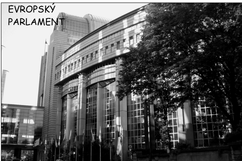
Evropský parlament - Brusel

Má stáž v Bruselu se uskutečnila ve dnech 14. - 27. 5. 2008 v kanceláři výše jmenovaného poslance. Pracovně jsem byla zařazena jako stážistka.