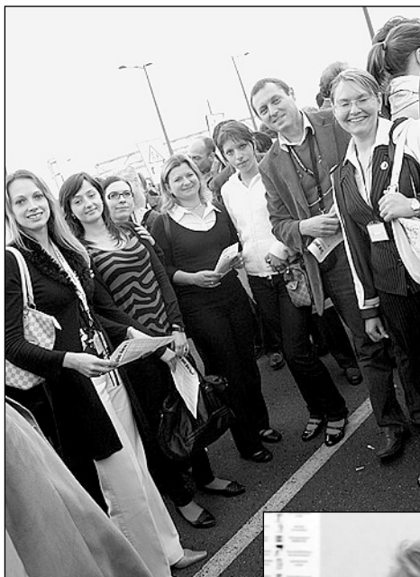
Štrasburk - demonstrace proti rasismu - poslanec, asistenti, stážisté