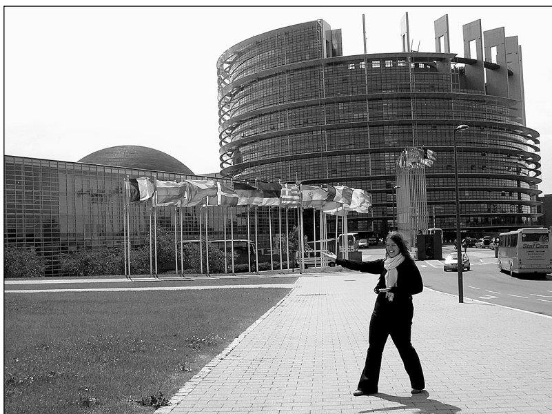
Sídlo EP ve Štrasburku... Vpřed do EP!