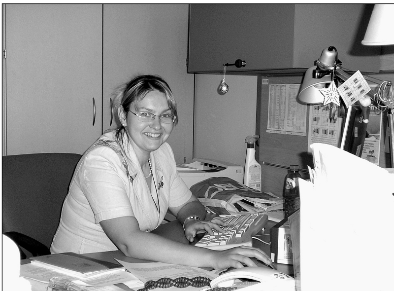
Takhle vypadá stážista zavalený prací