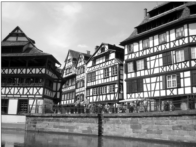
Štrasburk - La Petite France