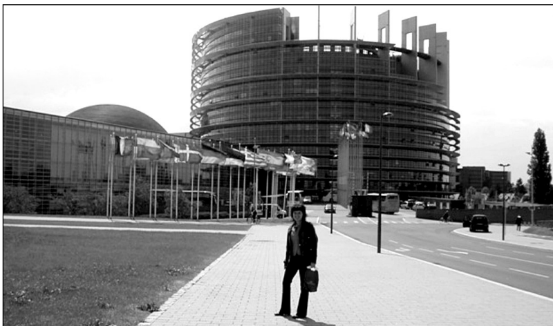
Evropský parlament - Štrasburk

Štrasburk je malebné, krásné a přívětivé město v Alsasku. Protéká jím řeka Rýn. V minulosti patřil střídavě k Německu i Francii, což ovlivnilo i jeho vzhled. Nejznámější je jeho katedrála Notre-Dame de Strasbourg, která pochází z 11. století. Některé městské domy ze 17. století mají vnější fasády hrázděné. Ve Štrasburku sídlí Rada Evropy, Evropský parlament a Evropský soud pro lidská práva. Od roku 1988 je historické centrum Štrasburku s názvem Grande Île zapsáno na Seznamu světového dědictví UNESCO. Na květnovém plenárním zasedání EP ve Štrasburku se europoslanci zabývali ochranou životního prostředí, politikou zaměstnanosti, silniční dopravou a dopady přírodních katastrof v Barmě a v Číně. V úterý 20. 5. byl vyhlášen Evropský námořní den. Kromě otázek souvisejících s přímořskými oblastmi EU a námořní politikou se pozornost evropských zákonodárců také zaměřila na ekologické problémy související s likvidací starých dopravních lodí v Asii.