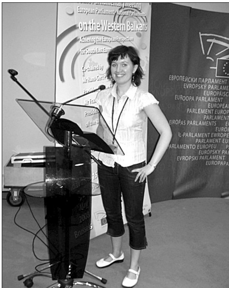
Konference o západním Balkánu

západního Balkánu, kterého se zúčastnili mimo jiné i poslanci ze Srbska a z Kosova. I přes napětí mezi oběma skupinami proběhlo setkání v duchu dobré spolupráce. Poslanci diskutovali o hospodářském a sociálním vývoji v regionu, o otázkách vizí a přistěhovalectví a o roli parlamentů v procesu integrace do Evropské unie.