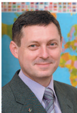
MUDr. Jiří Maštálka poslanec EP GUE/NGL, KSČM