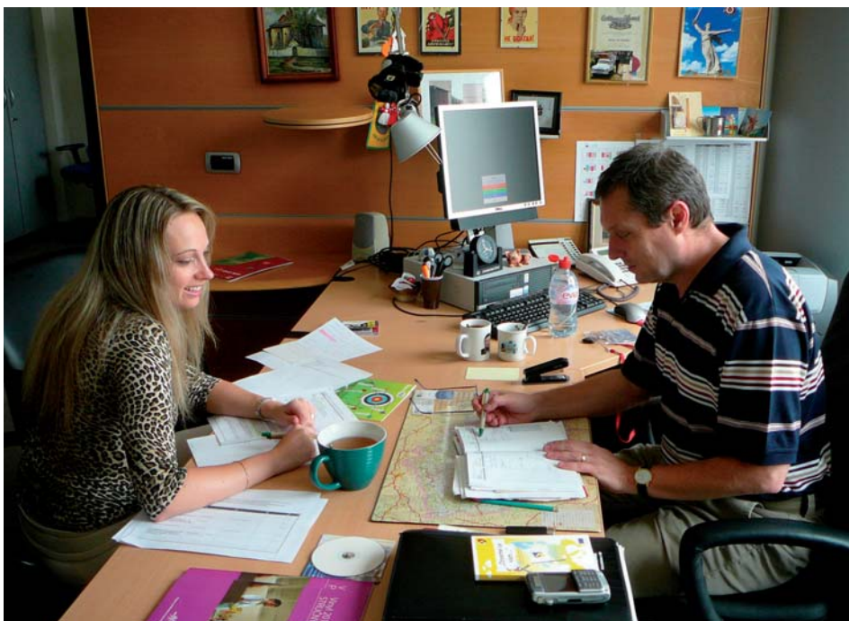
Z přípravy na výstavu

Výstavu o RUDN shlédlo po dobu jejího konání na 1000 návštěvníků – tedy o mnoho více, než souběžnou výstavu v EP, věnovanou 20. výročí „pádu železné opony“, kterou zaštiťovali bývalý český prezident Václav Havel a předseda EP Jerzy Buzek. Mezi návštěvníky výstavy o RUDN byl i kandidát na funkci eurokomisaře Š. Fülle, který se pochvalně vyjádřil jak o tématu výstavy, tak o RUDN jako takové.