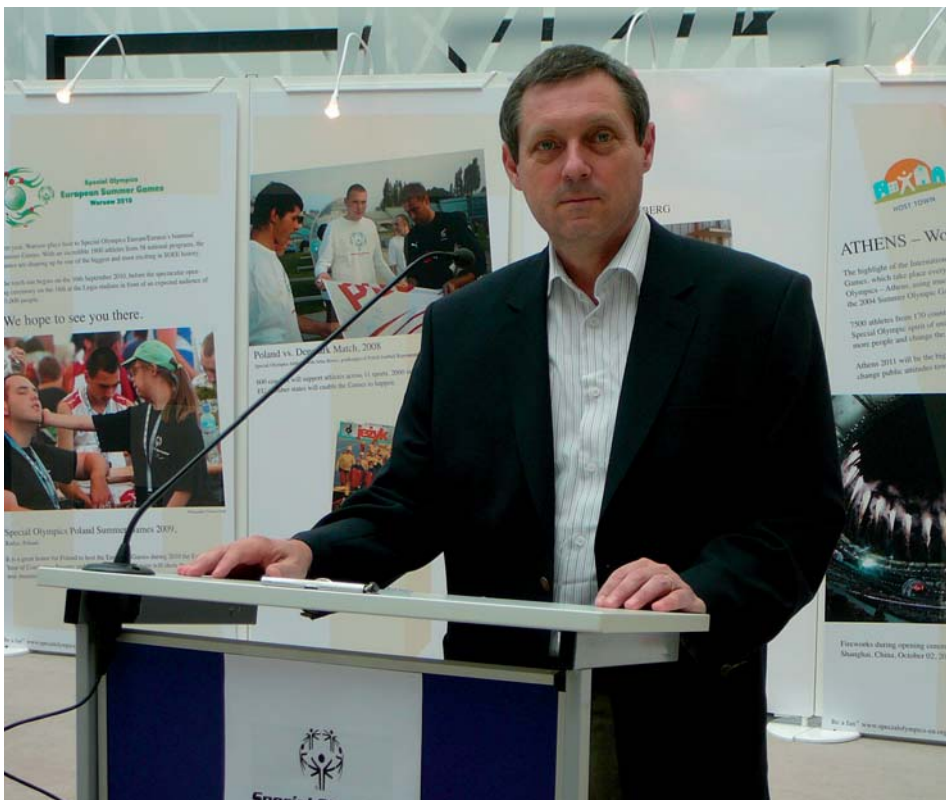
Poslanec EP Jiří Maštálka při vystoupení na jedné z kulturně-politických akcí pořádaných v Evropském parlamentu

Lisabonskou smlouvou dostává Evropská unie statut mezinárodní organizace (doposud na ní bylo pohlíženo jako na mezistátní organizaci sui generis) a stává se právníkou osobou (doposud tomu tak nebylo, statut právnícké osoby mělo Evropské společenství jako tzv. první pilíř EU a také organizace Euratom). EU se stává právním nástupcem Evropského společenství. Z tohoto důvodu bude od 1. prosince 2009 odstraněna dosavadní „pilířová struktura“ EU. EU bude mít me-